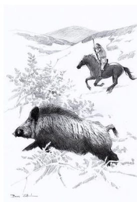
A grafikákatt készítette Boros Zoltán természetfestő